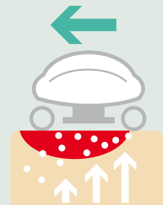
Bőrvérkeringést Elősegítő Vákuumos Masszázs